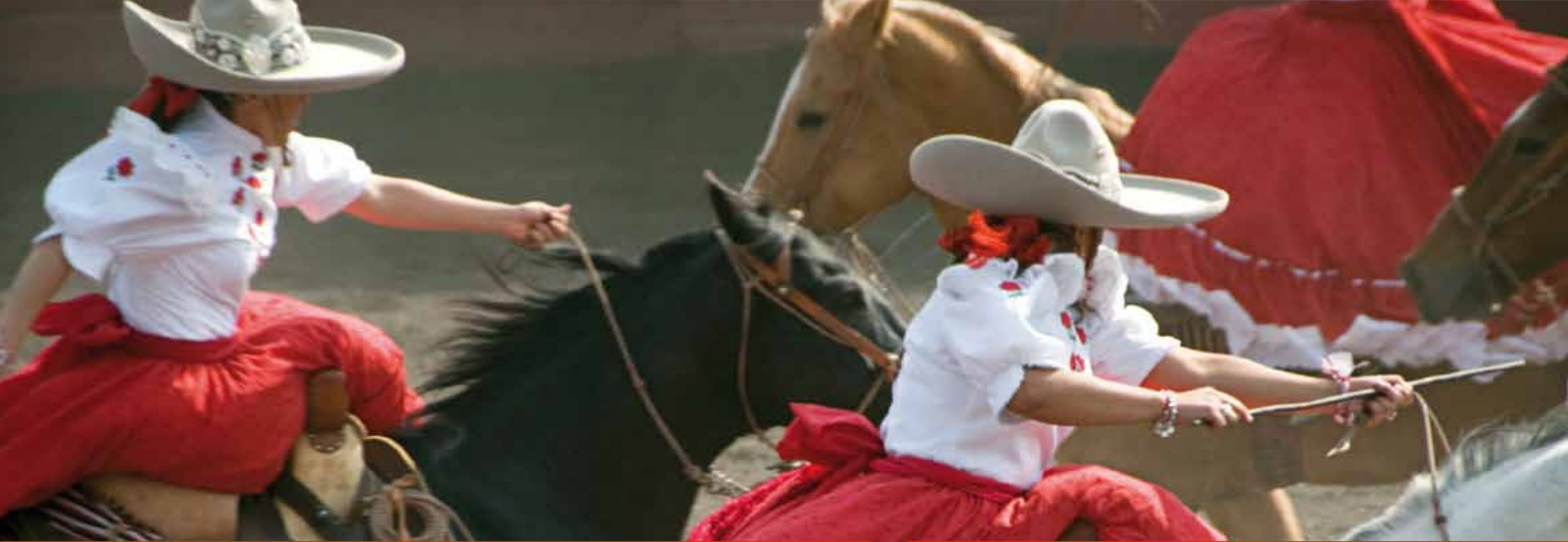
Mexico City – Mexico 24°N

Quý khách đang bước vào cuộc sống với những trải nghiệm phong phú và hoàn hảo hơn bao giờ hết. Đó là nơi khái niệm quốc tế trở thành một quốc gia khổng lồ với vô vàn tiện ích đang đón chờ khám phá và tận hưởng, nơi Quý khách sẽ làm được nhiều hơn, thấy được nhiều hơn và thực sự sống nhiều hơn mỗi ngày.